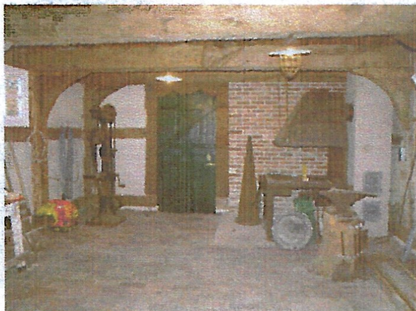
Blick in die Schmiede