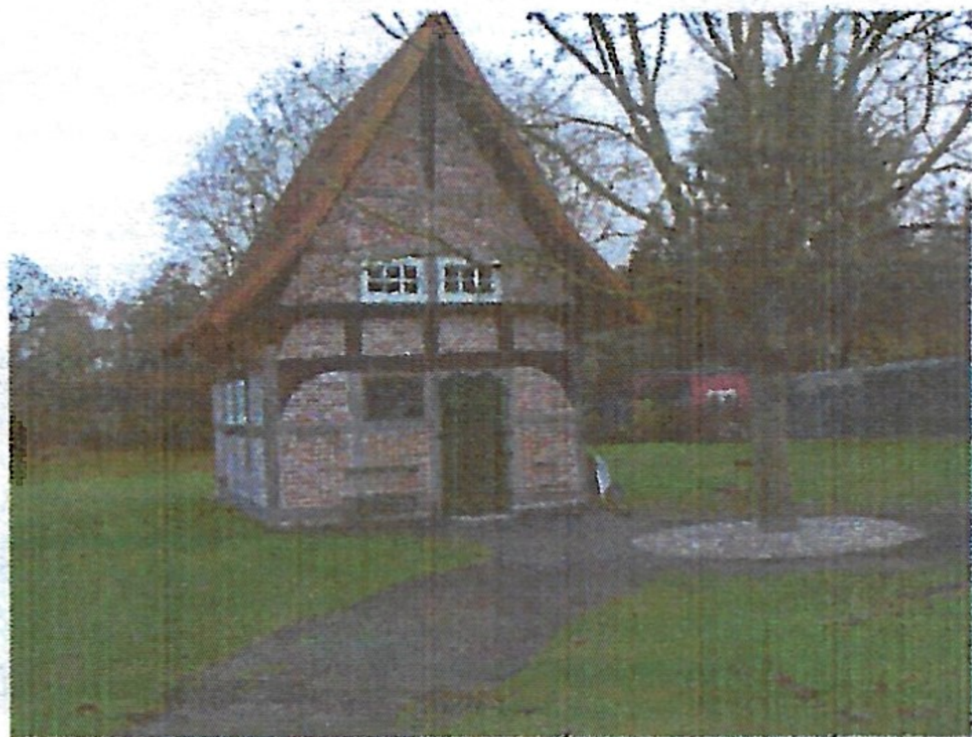
Schmiede mit Walnussbaum und Pflasterung

„Was lange währt, wird endlich gut.“ wussten schon die alten Römer. Der Spruch passt aber zu unserer Schmiede. Wir sind endlich so weit, dass wir unser Bauwerk präsentieren können. Es müssen lediglich noch einige kleine Arbeiten ausgeführt und einige Gerätschaften beschafft werden. Der Dachboden ist bereit, um die Exponate unserer Schmiedeausstellung aufzunehmen. Auch im Außenbereich hat sich einiges getan. Es wurde gepflastert und eine Rundbank um den Walnussbaum aufgestellt. Dies alles wäre nicht möglich gewesen, wenn es nicht fleißige Helfer gegeben hätte. Vielen Dank an alle. Die Bilder sollen Ihnen einen kleinen Eindruck von unserer Schmiede verschaffen.