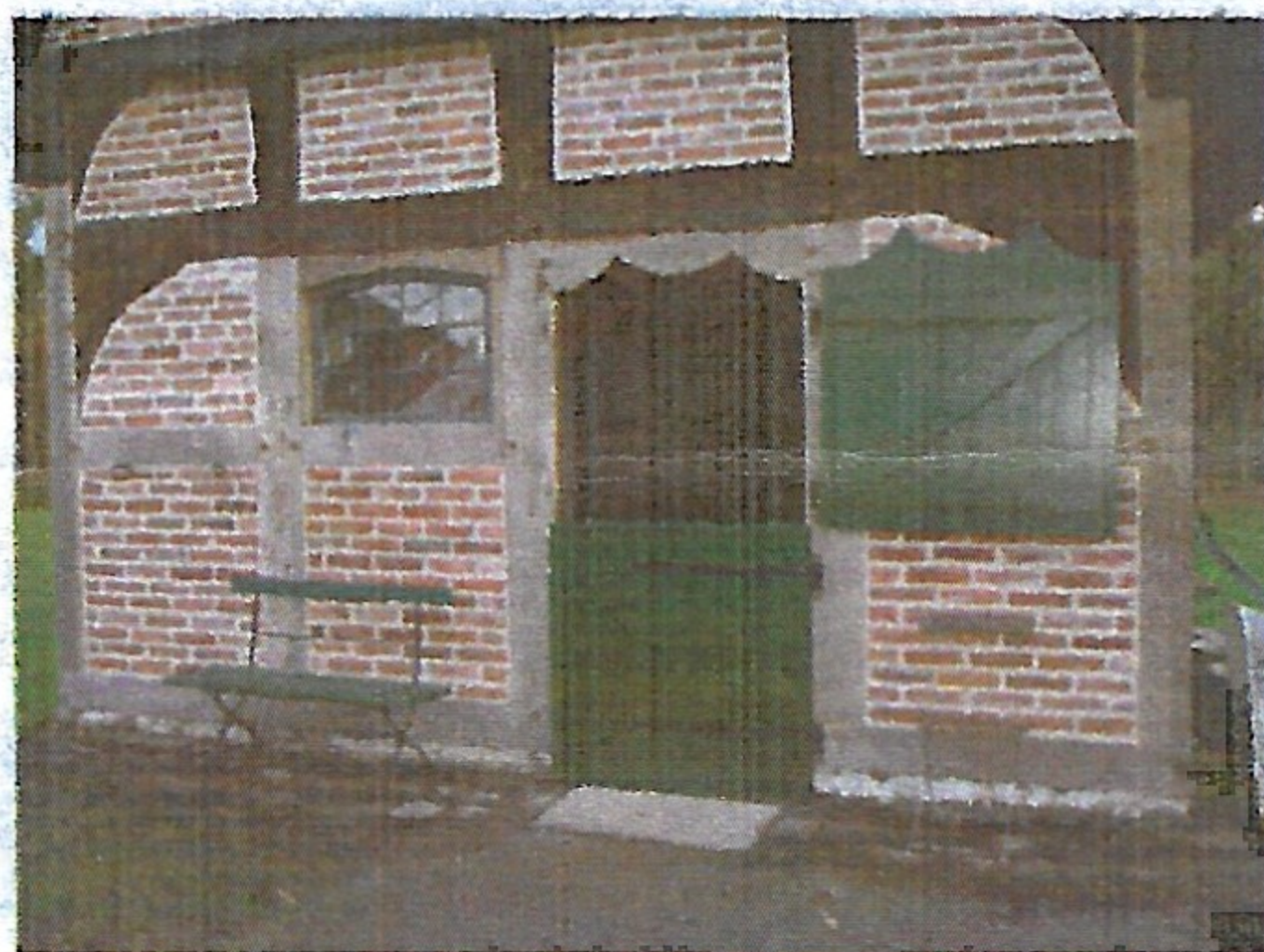
Eingang mit „Klöntür“